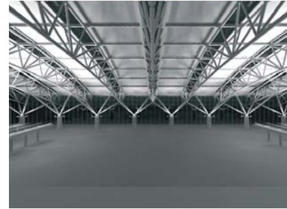
Computer-Simulation Terminal 2, Grauwertdarstellung Computer-simulation Terminal 2, greyscale coding

Both during the day and at night, the light planning gives a pleasant atmosphere to the space beneath the big, curved roof, which in places reaches a height of 24 metres. The lighting-concept of Hamburg Airport picks up on the prevailing conditions outside and responds to them with changeable artificial lighting. The result: a "breathing" lighting mood that makes