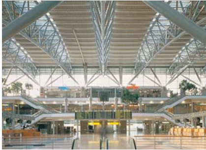
Terminal 4 Abflughalle, Tag Terminal 4, departure lounge, day

Vorige Seite Terminal 4 Abflughalle, Nacht Previous page departure lounge, night